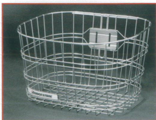
リコール対象バスケット